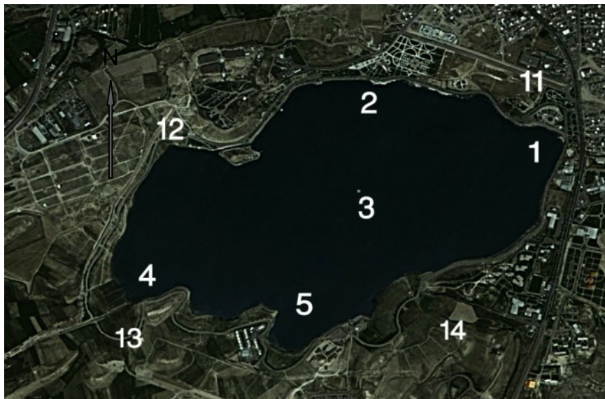
شکل شماره ۲: نقشه موقعیت ایستگاه های آب و خاک ( شماره های ۵ - ۱ - مربوط به نمونه های آب و شماره های ۱۴ - ۱۱ مربوط به نمونه های خاک می باشد)