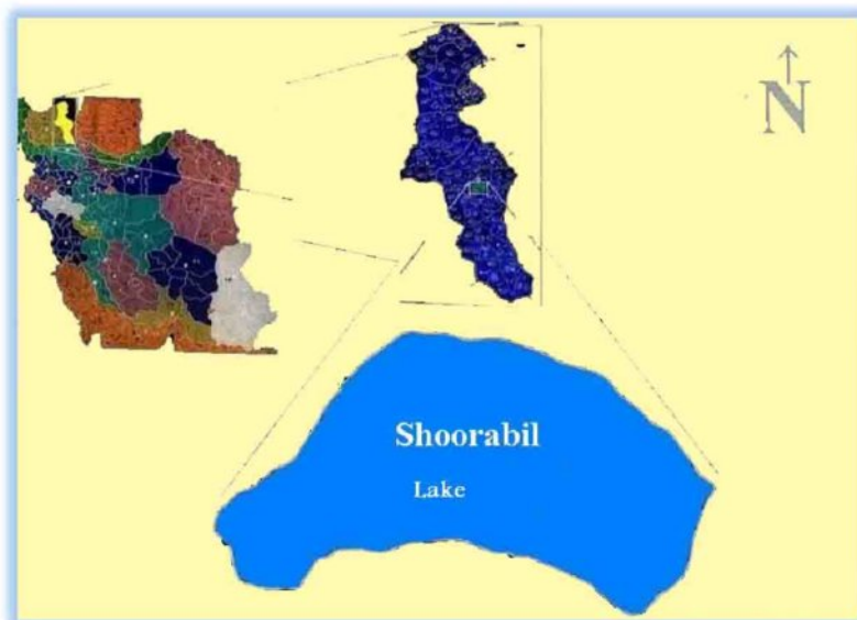
شکل شماره ۱: نقشه موقعیت استان، شهرستان اردبیل و دریاچه شورابیل در کشور ایران

در این میان تالاب شورابیل در جنوب شهر اردبیل و در محدوده آن واقع شده است. در شکل شماره ۱ موقعیت استان، شهرستان اردبیل و دریاچه شورابیل در محدوده کشور ایران نشان داده شده است.